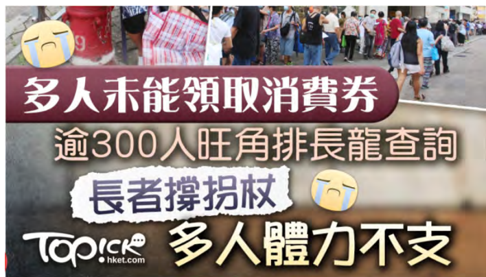
▲ 旺角始創中心外約300人排隊查詢5000元消費券，人龍由彌敦道排到西洋菜街。

有現場輪候、約70歲的張女士指，對政府的安排、特別是對財政司司長陳茂波感到十分失望，認為是次申請手續太繁複，缺乏誠意，希望政府可以將申請手續盡量簡化或以現金派發，據她了解自己或填漏6月18日前不得離港的聲明。