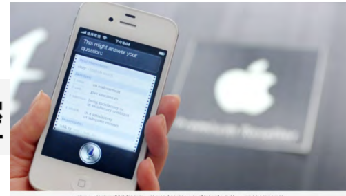
▲ 蘋果Siri偷聽用戶對話被起訴，美國地方法院法官接受侵犯隱私指控。

據外電報道，美國地方法院法官懷特（Jeffrey White）裁定，允許針對蘋果公司的一宗訴訟繼續進行，該訴訟稱蘋果語音助手Siri侵犯用戶隱私，但駁回根據加州《不公平競爭法》提出的一項指控。